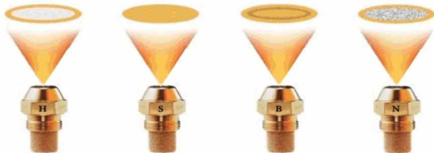
Hohlkegeldüsen H Vollkegeldüsen S Halbhohle Düsen B Spezielles Hohlmuster N